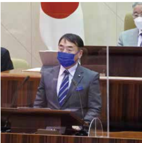
12月定例会で一般質問