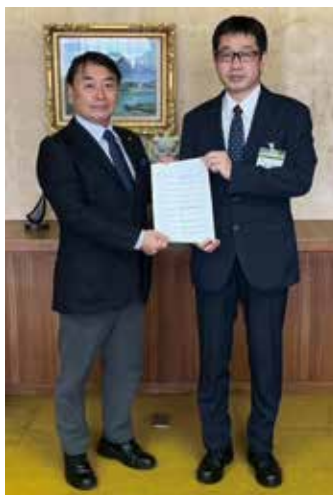
泉区長へ来年度予算の要望