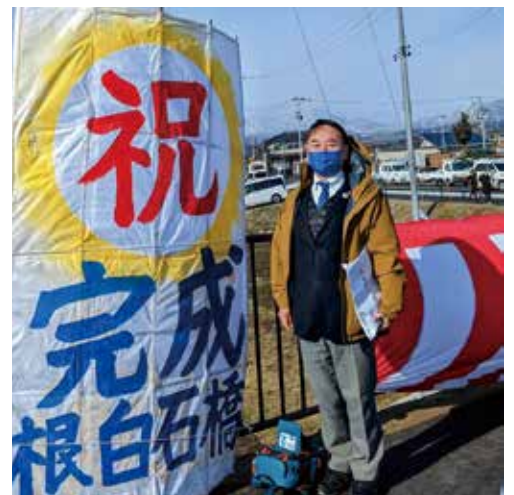
クリスマスの日に根白石橋が開通