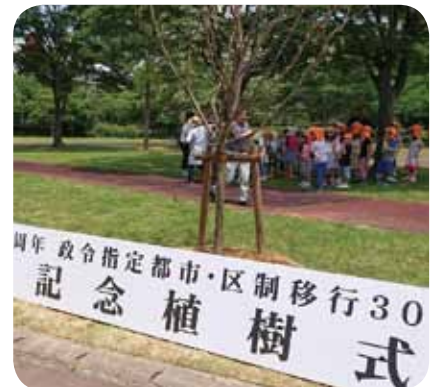
7月2日 七北田公園内に区制移行30年記念の植樹(紅白梅5本)