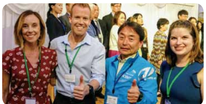
5月12日 仙台ハーフマラソンでは米国ダラス市の選手団と姉妹都市交流。同市とは積極的な経済交流を。