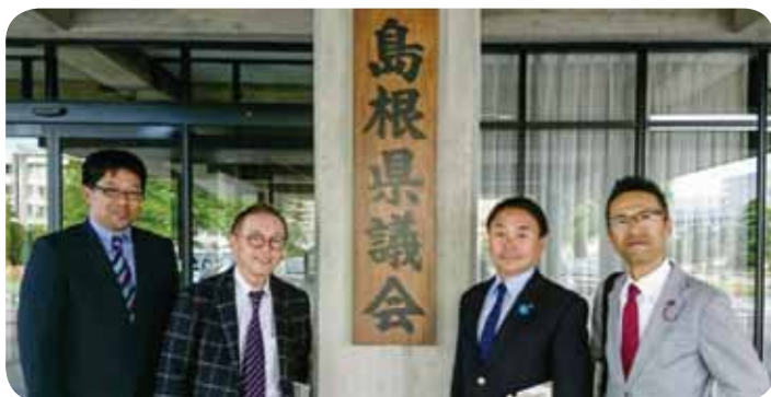
5月8日～10日 会派行政視察。仙台～出雲便を利用して島根県および出雲市を調査。