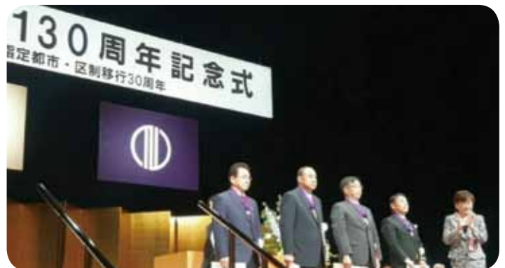
7月1日 仙台市制施行130周年記念式にて同僚議員とともに市政特別功労者章を拝受しました。