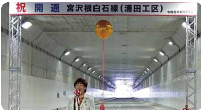
6月29日 宮沢根白石線浦田工区が開通し、北根交差点から4号バイパスが直接つながりました。